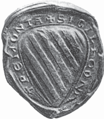
Siegel des Grafen Konrad II. von Dortmund [aus: MEININGHAUS, Grafen [1915] (wie Anm. 7), Siegeltafel nach S. 172]

Dortmunder Grafenhauses in der Lindenhorster Kapelle beigesetzt wurden, muss ungeklärt bleiben, da die angestammte Grabstätte der Grafen die Martinskapelle des Grafenhofes war. Beim Neubau des Lindenhorster Kirchenschiffes im Jahre 1911 traten jedenfalls zahlreiche Gebeine zutage. Sie wurden aufgesammelt und beim Turm erneut bestattet.