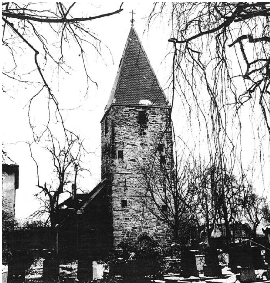
Abb. 1: Kirche in Lindenhorst (um 1965)

„Dortmunder Beiträgen“ folgen ließ. 8 Am gleichen Ort veröffentlichte Otto Schnettler 1932 einen hypothesenreichen Aufsatz mit dem Titel „Lindenhorst und das Geschlecht von Dortmund“. 9